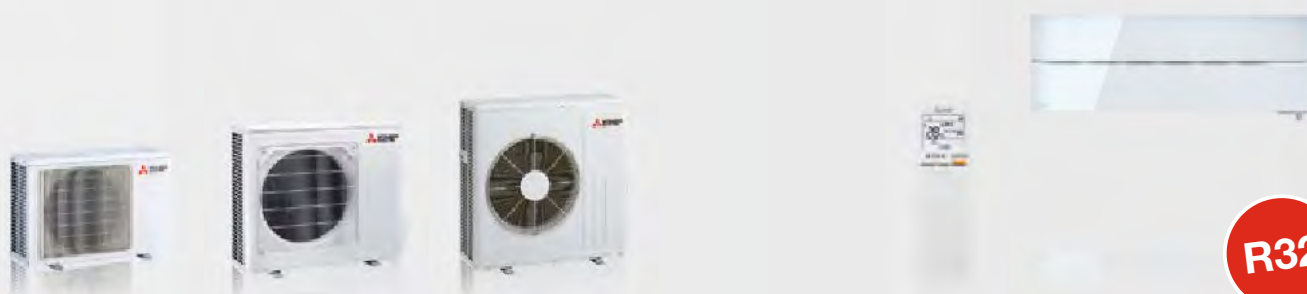
MUZ-LN25 / 35VG2