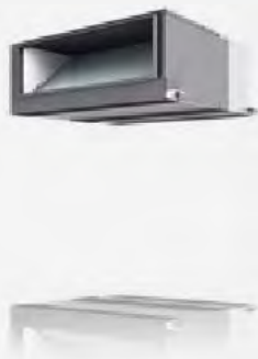
PEA-M200 / 250LA