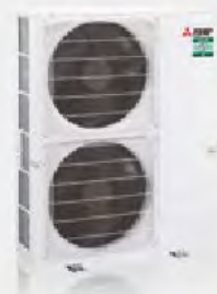
PUZ-ZM200 / 250YKA2